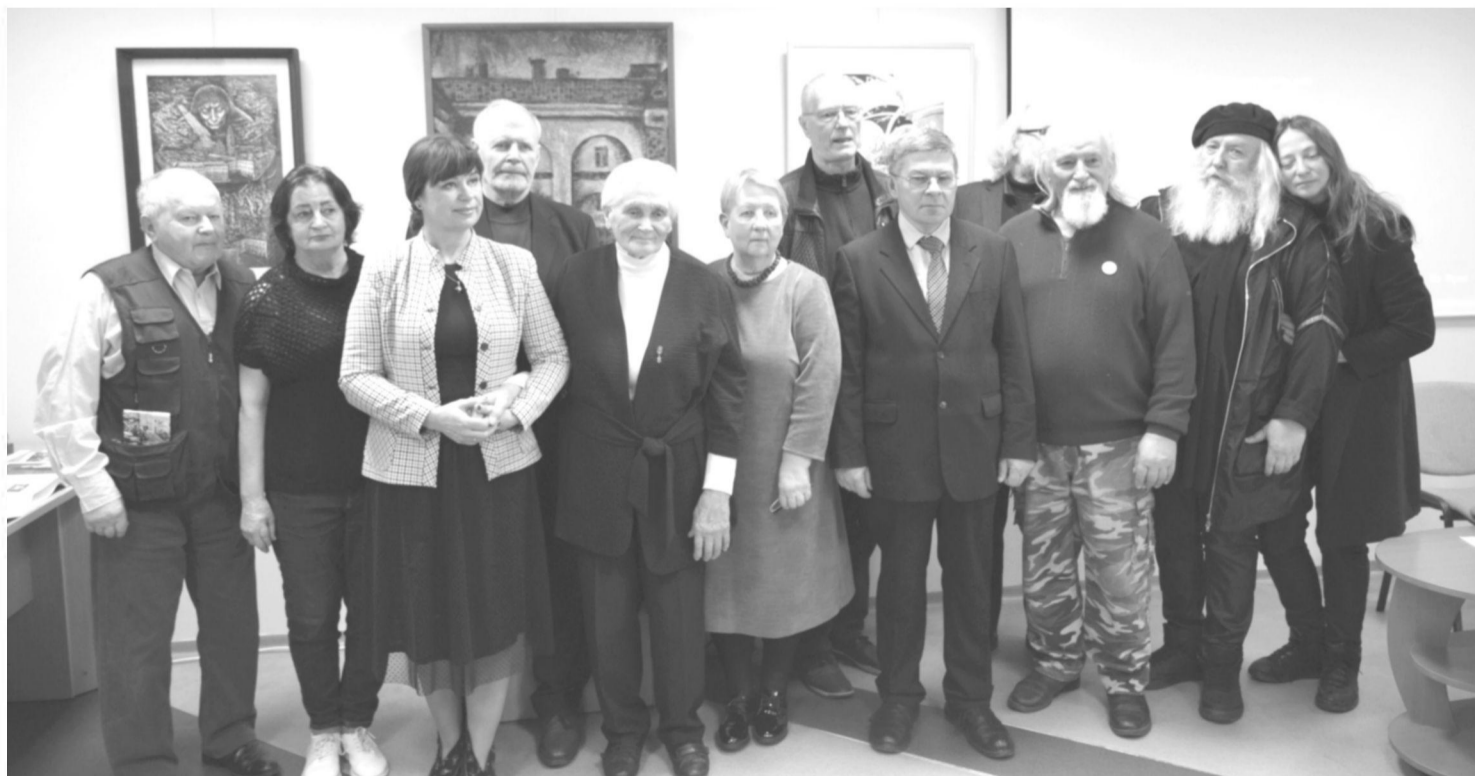
Dalyvavo gausus būrys svečių, savivaldybės atstovų bei giminaičių