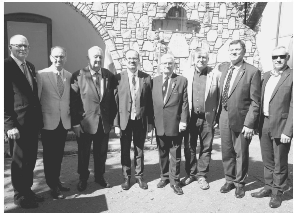
LPKTS delegacija su „Sibiro sąjungos“ vadovais