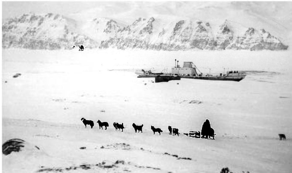
Šunų kinkinys šiaurinėje Jakutijoje. Tit Arų apylinkės, apie 1955 m. (šunys – pagrindinė susisiekimo priemonė Arkties vandenyno pakrantėse ir didžiųjų Lenos, Janos upių deltose. Kinkinių varovai – kajūrai (nencų k.) tam, kad išgyventų, turėdavo išmokti orientuotis užšalusiame Lenos protakose)

pasakojant jas patyrusių žmonių likimus, įprasminančius nepriklausomą Lietuvą, tremtį, įkalinimą ir viltis bei jų išsipildymą sugrįžti į Lietuvą. Albumas skiriamas visų represuotųjų atminimui. 1953 m., prieš septyniasdešimt metų, vieno brutaliausių XX a. diktatorių Josifo Stalino mirties išvakarėse, iš Lietuvos į Sovietų sąjungos gilumą išgabentos paskutinės masinių trėmimų aukos. Iš viso iki 1953 m. į tremtį išvežta 132 tūkst. Lietuvos gyventojų, dar apie 156 tūkst. įkalinta sovietų lageriuose ir kalėjimuose. 1940–1990 m. sovietų okupuotoje Lietuvoje masinių represijų aukomis tapo apie 300 tūkst. gyventojų.