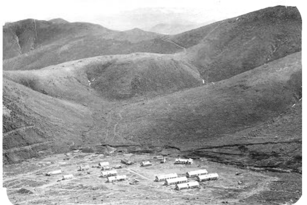
Matrosovo lageris Kolymos kalnų slėnyje. Berlagas, Magadano sr., 1956 m.