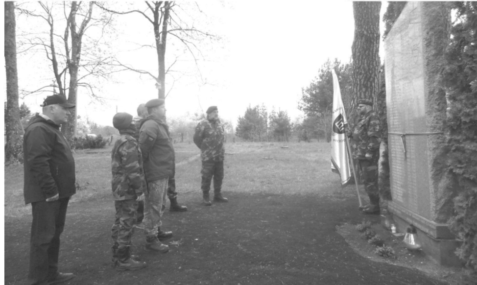
Pagerbtas 1944–1953 m. Laisvės kovose žuvusių Onušio krašto rezistentų atminimas (Onušio mstl. senosiose kapinėse)

riškes, kaimas vadintas Trakų apskrities ar net „visos Lietuvos“ kontrevoliucijos centru. Sovietiniai partizanai tiesiog buvo „priversti“ užpulti Bakaloriškes, nes kitos išeities, alternatyvos ginkluotos jėgos panaudojimui ir žiauriai kolektyvinei kaimo žmonių bausmei neturėjo.