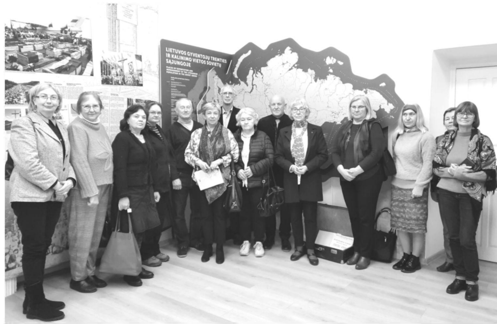
Konferencijos dalyviai LPKTS muziejuje