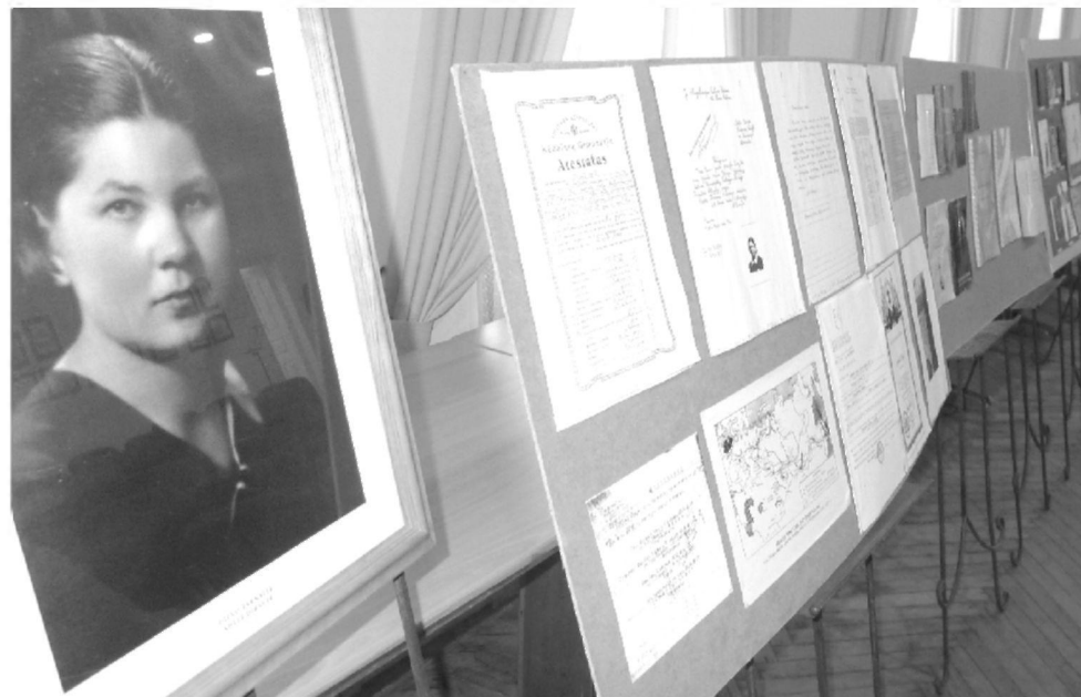
Paroda LPKTS Adelei Dirsytei atminti

sužadindamas užsienio lietuvių pasigėrėjimą. Ateitininkų organizacija JAV netrukus parūpino pirmąją Sibiro lietuvių maldaknygės laidą 1959-aisiais. Vėliau tekstai, Vatikano radijo bangomis pasiekę Lietuvą, išleisti pagrindžio spaudos sąlygomis, taip pat susilaukė pakartotinių leidimų.