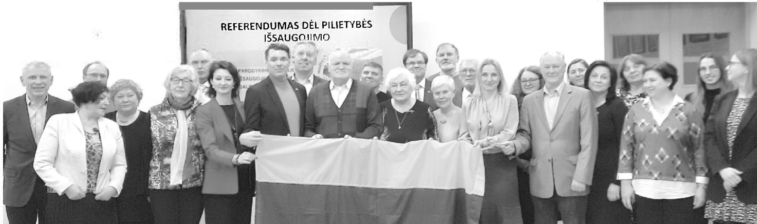
Diskusija dėl pilietybės išsaugojimo Lietuvos Sporto universitete

Balandžio 8–12 dienomis LR Seime vyko Pasaulio lietuvių bendruomenės (PLB) ir Seimo komisijos posėdžiai, kurių metu aptarti diasporai aktualūs klausimai – nuo paskutinių darbų prieš pilietybės išsaugojimo referendumą iki pasirengimo pilietiniam pasipriešinimui. Komisija priėmė septynias rezolucijas, kurios buvo pristatytos surengtoje spaudos konferencijoje.