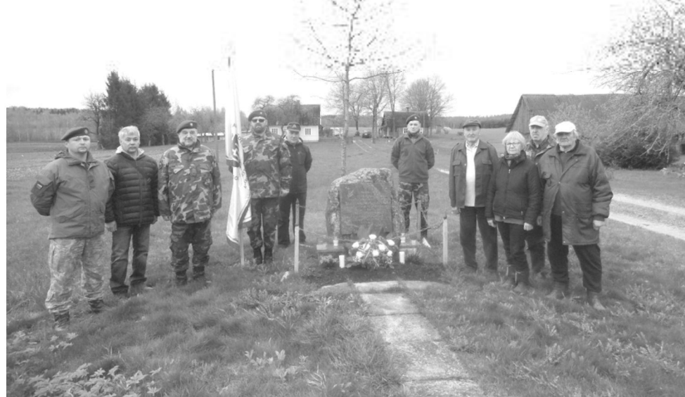
Pagerbtas 1944 m. sudeginto Bakaloriškių kaimo bei 1944–1953 m. Laisvės kovose žuvusių Bakaloriškių ir gretimų kaimų rezistentų atminimas

melagingų, absurdiškai išpūstų, demagoginių faktų ir vertinimų apie Pietryčių Lietuvos kaimų savisaugininkų veiklą, o kaltinimus bakaloriškėčiams apie jų neva nužudytus 300 „tarybinių žmonių“ galima laikyti tokios melagingos demagogijos viršūne. Įsismaginus propagandiniame „kare“ apie Bakalo-