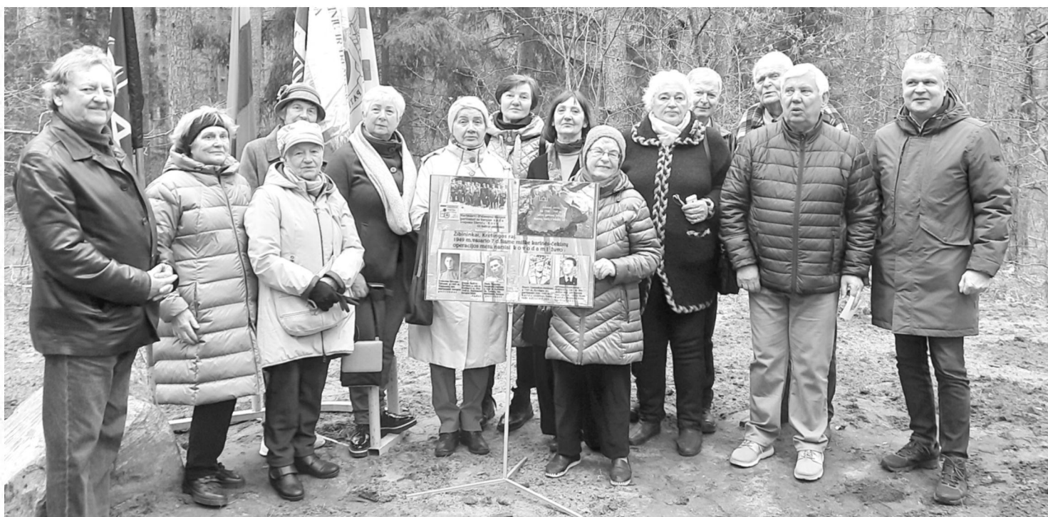
Partizanų pagerbimo vietoje LPKTS Palangos filialo nariai ir kiti svečiai