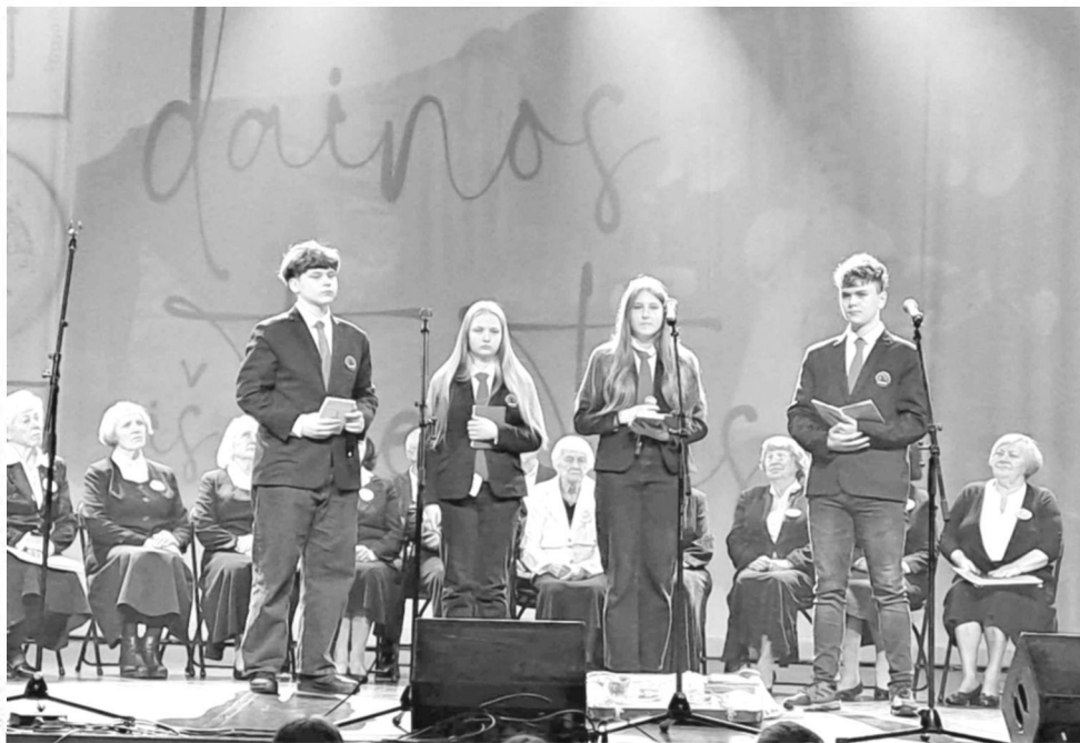
Varėnos gimnazijos moksleiviai