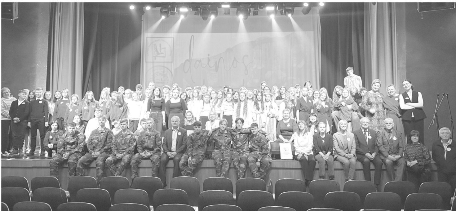
Moksleivių dainų festivalio „Dainos iš tremties“ dalyviai ir svečiai Varėnos kultūros centre

Jau tapo tradicija, kad devinto respublikinio moksleivių dainų festivalio „Dainos iš tremties“ dalyvius priėmė Varėnos kultūros centras. Džiugu, kad šis festivalis rengiamas Varėnoje – krašte, kuris labai susijęs su 1944–1953 m. vykusia partizanine kova, su žymiais partizaninio pasipriešinimo vadais Juozu Vitkumi-Kazimieraičiu ir Adolfu Ramanasku-Vanagu. Ir nemažai nulėmė Varėnos rajono savivaldybės vadovų požiūris į mūsų krašto istorinės atminties puoselėjimą.