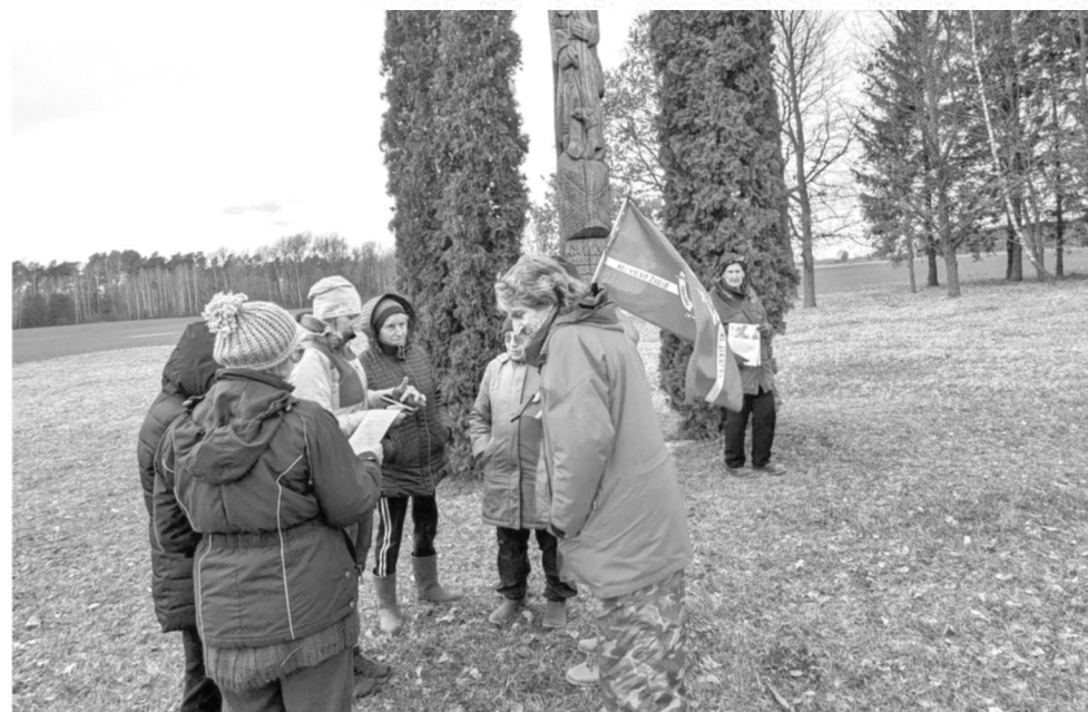
Stebeikėlių kaime yra išlikęs stogastulpis