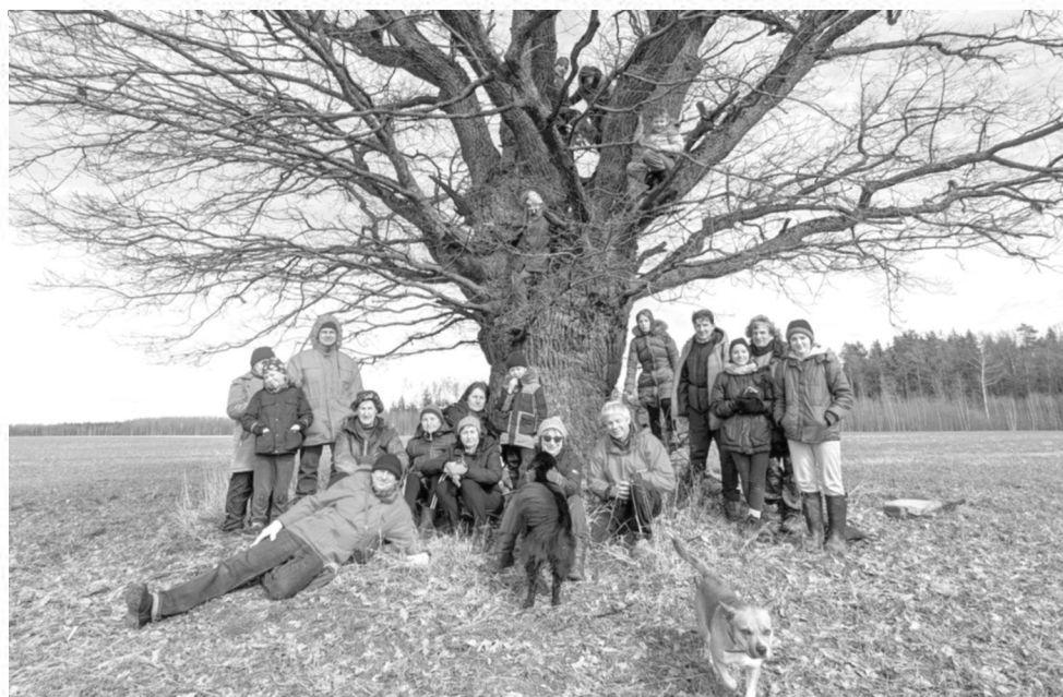
Stebeikėlių kaime, poeto Bernardo Brazdžionio gimtinėje, prie ažuolo