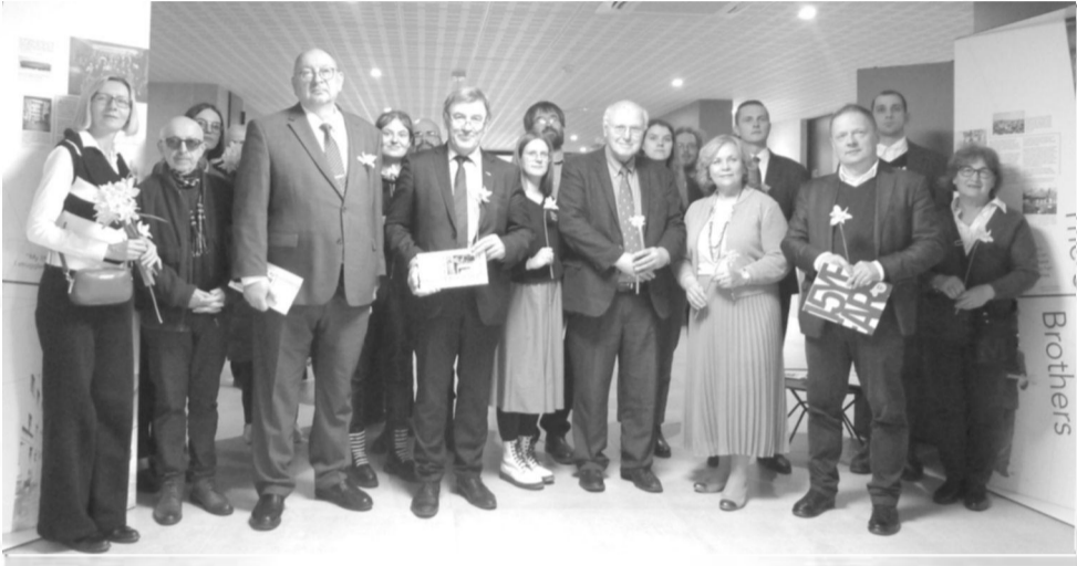
Kaune, Vytauto Didžiojo universitete, parodos atidarymo svečiai ir dalyviai