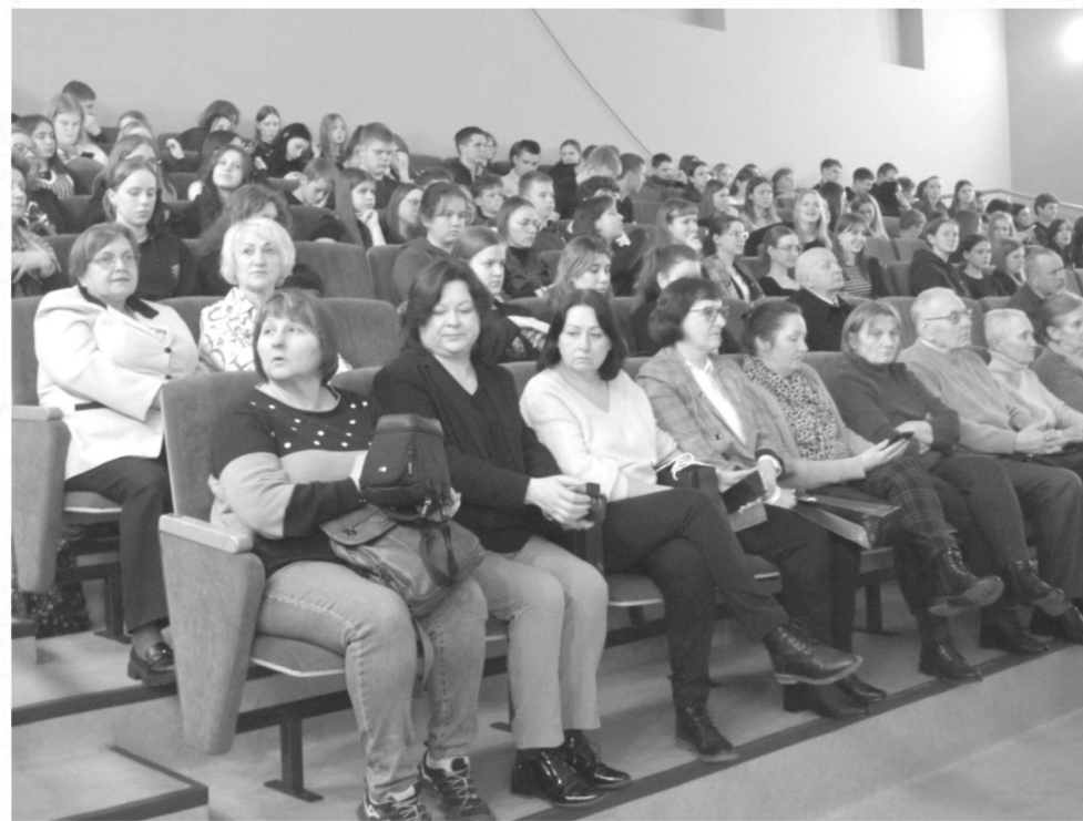
Pilnutėlė salė susidomėjusi žiūrėjo filmą