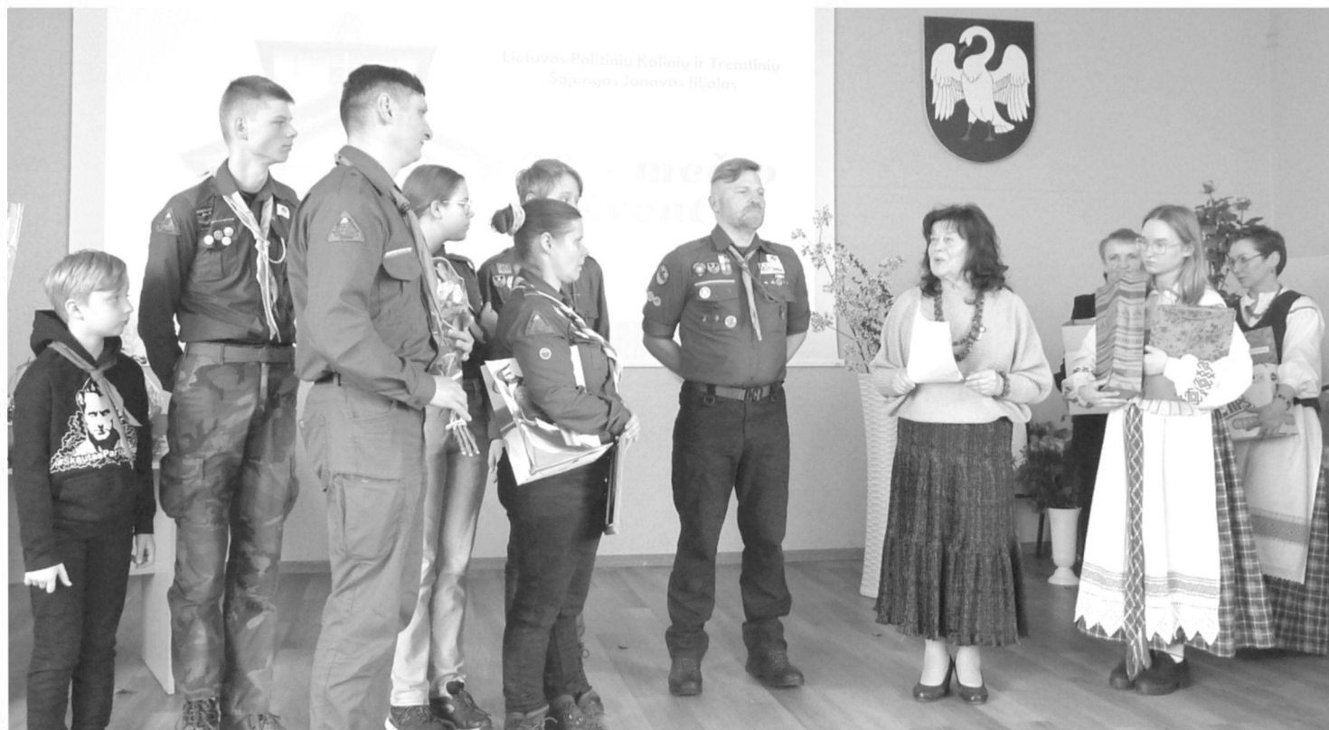
Buvusius tremtinius tvirta draugystė sieja su Jonavos skautais