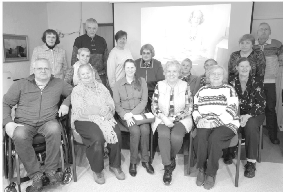
Atminimo popietės dalyviai Panevėžio miesto Parko bibliotekoje

Klausėmės poetės žodžiais sukurtų dainų. Esame labai dėkingi už surengtą prisiminimo popietę.