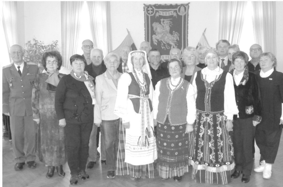
Minėjimo dalyviai LPKT sąjungos salėje