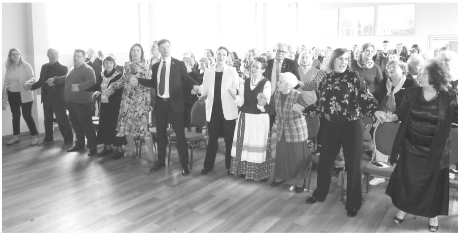
Dainą „Žemėj Lietuvos qžuolai žaliuos“ dainavo visa salė