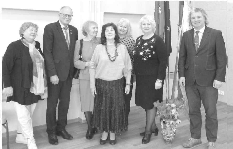
LPKTS Kauno filialo delegacija, atvykusi pasveikinti bendraminčių