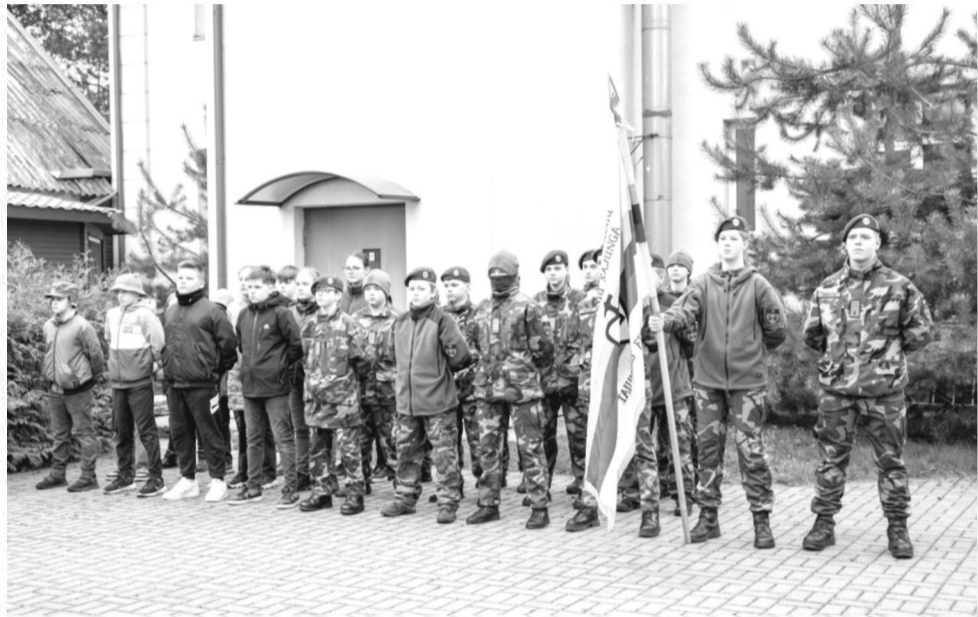
Minėjimo dalyviai – jaunieji šauliai

Tremties ir rezistencijos muziejus paminėjo paskutinį Jūros būrio mūšį balandžio 12 dieną. Pirmiausia memorialie prie Tremties ir rezistencijos muziejaus šauliai, jaunieji šauliai ir buvę tremtiniai uždegė žvakučių ir padėjo gėlių. Po to visi vyko į Žygaičius, kur