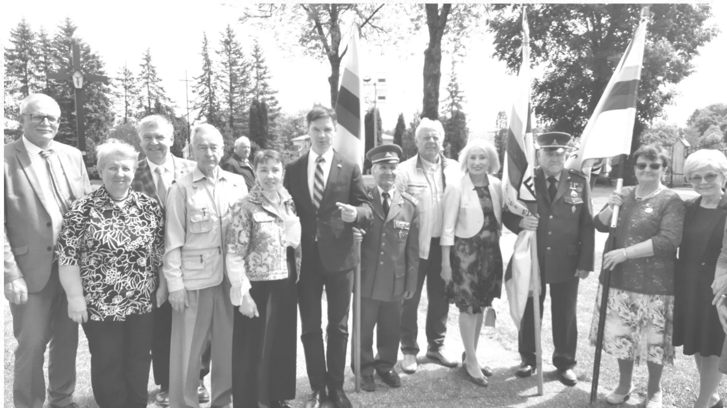
Po šv. Mišių svečiai iš Seimo ir Lietuvos politinių kalinių ir tremtinių sąjungos filialų