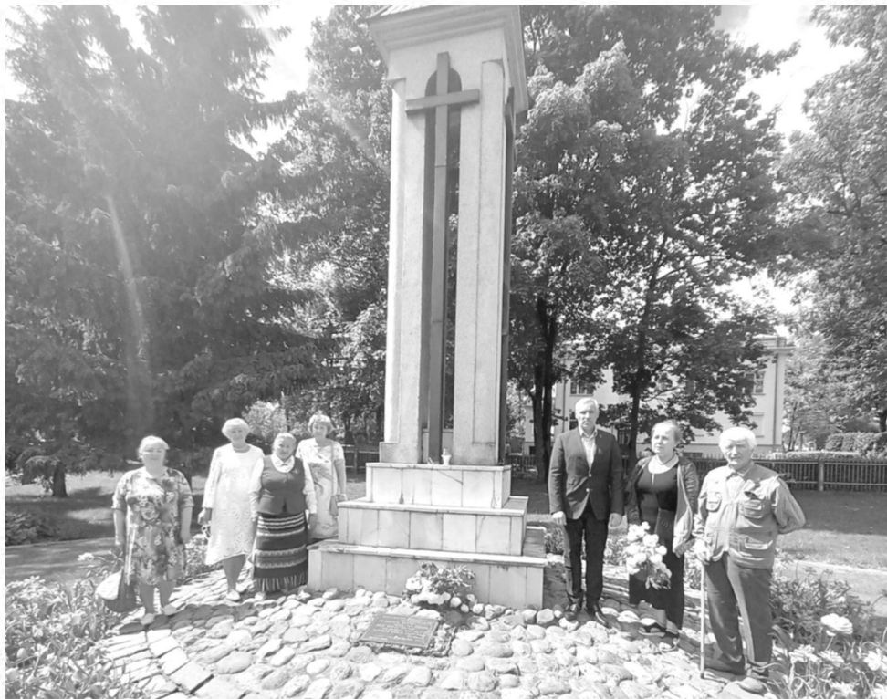
Prie kopyltėlės atidengtos 1991 m. birželio 14 d. (architektas Z. Galadauskas)

Lietuvos kariuomenės paskelbtas šūkis šiai dienai „Mes – tai Jūs“ pažymi, kad karys yra mūsų visuomenės dalis, kad jam svarbu, kokia bus Lietuvos ir kiekvieno iš mūsų ateitis, o visuomenės palaikymas yra didžiulė motyvacija.