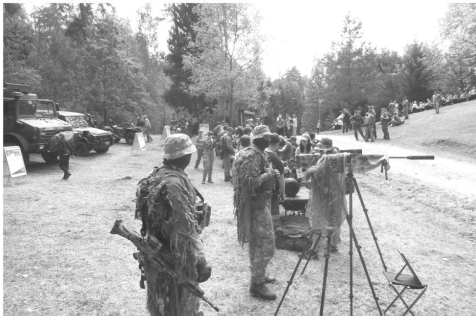
Lazdijų rajone, Kalniškės miške, buvusio mūšio vietoje