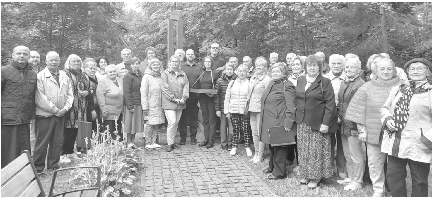
Gargždų parke prie kryžiaus Tautos skausmui atminti