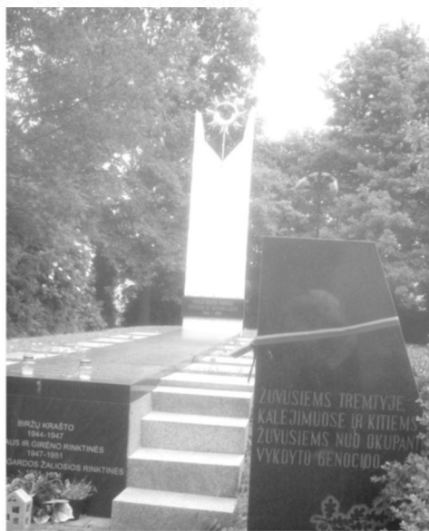
Memorialas Biržų krašto kovotojams