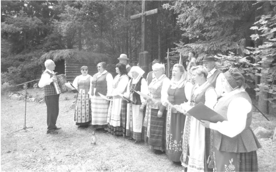
Daimuoja ansamblis „Varčios aidai“