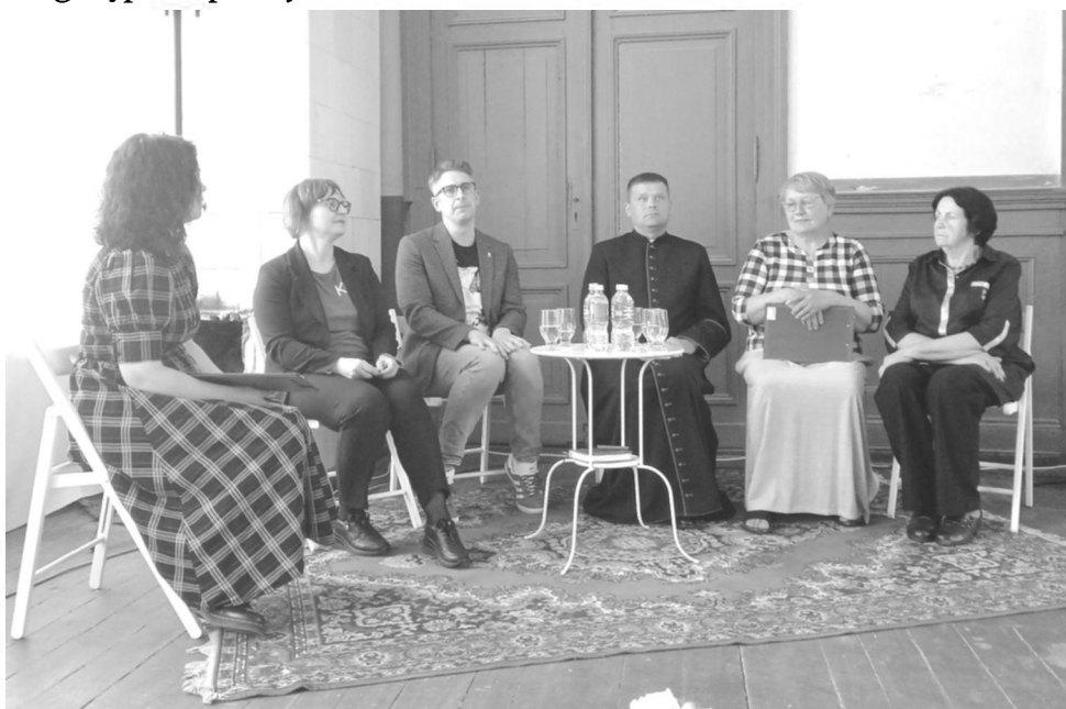
Diskusija „Išsaugotas žmogiškumas“