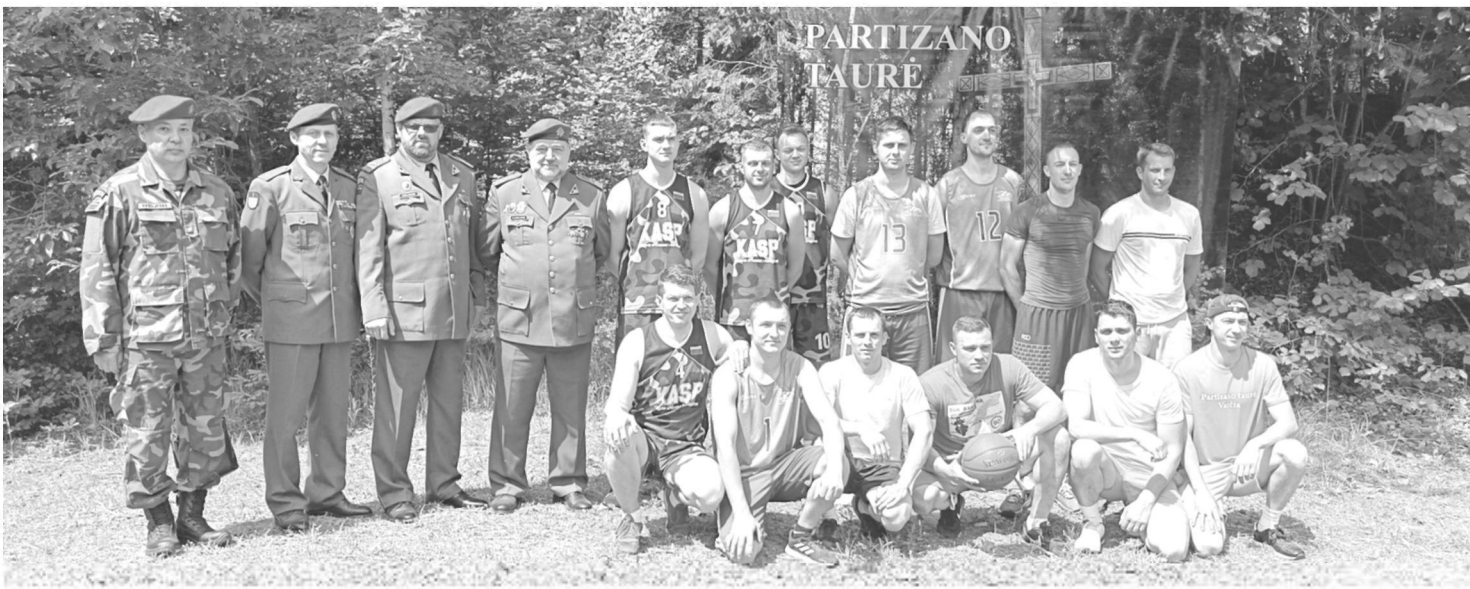
Prie Lietuvos partizanų atminimui skirto kryžiaus

Birželio 15-osios popietę Alytaus rajono savivaldybės kultūros centro Alovės skyrius kartu su Alovės bendruomenės visuomenine organizacija „Susiedai“ pakvietė į Varčios mišką (Alytaus r., Daugų sen., Dušnionių girininkijos 223 kvartalo teritorija) prie Lietuvos partizanų atminimui skirto kryžiaus pagerbti 1945 m. birželio 13–14 bei 23–24 dienomis Varčios mūšiuose žuvusių partizanų atminimą.