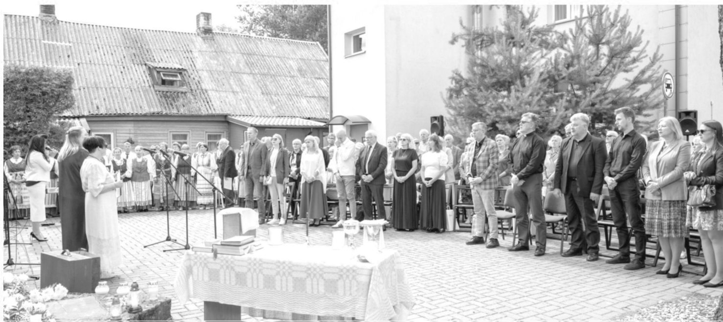
Šv. Mišios „šubartinės“ kiemelyje