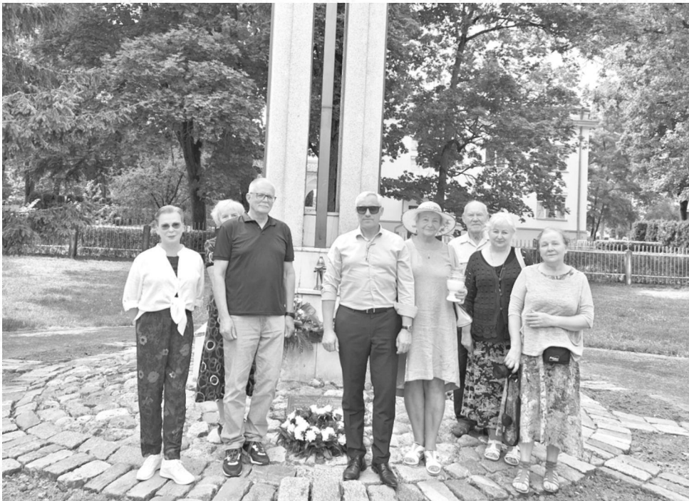
LPKTS Marijampolės filialo nariai ir svečiai