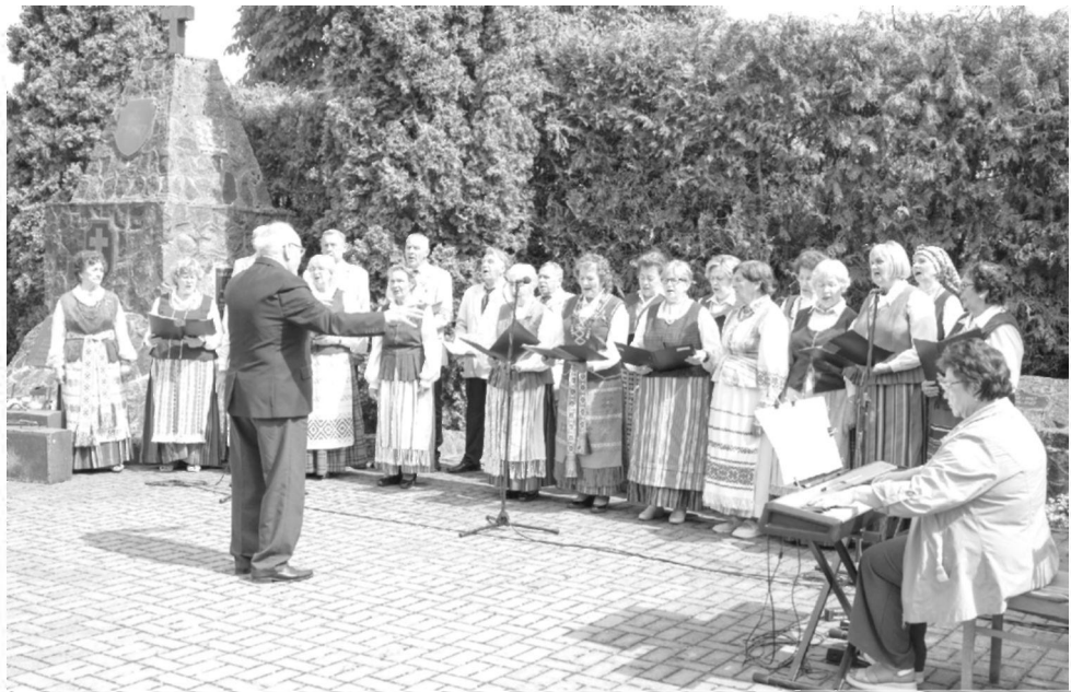
Dainuoja Tauragės kultūros centro mišrus choras „Tremtinys“