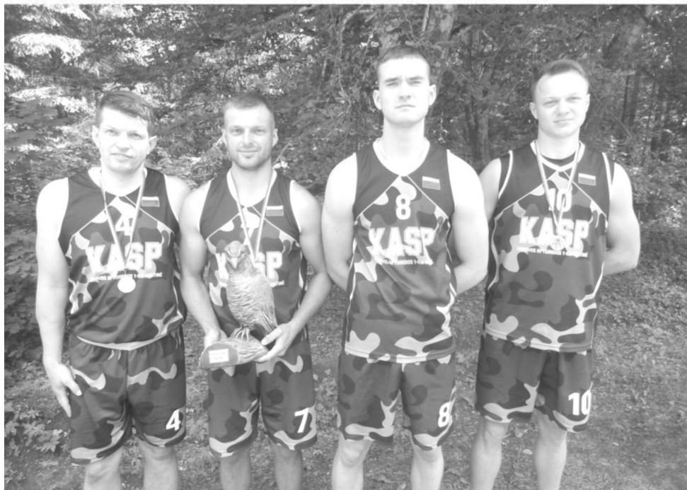
„Partizano taurės“ laimėtojai

talionių kariai atvyko ir išsilaipino Alovės valsčiaus Kudariškių kaime. Tuo pačiu metu pradėjo supti Varčios mišką ir nuo Meškučių kaimo pusės puolė ten įsikūrusių Vanago kuopos apie 90 partizanų stovyklą. Kautynės prasidėjo ryte, sargybai pastebėjus besartinantį