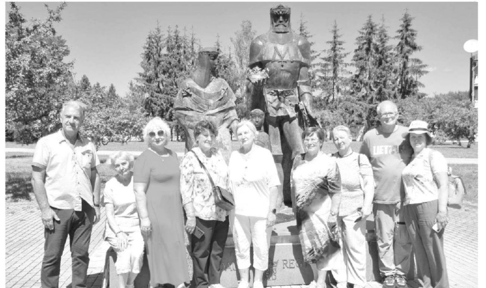
Agluonoje prie didžiųjų karalių