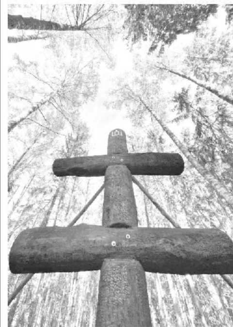
Juodasis dvigubas kryžius – partizanų ženklas

Šiame Lietuvoje minint partizaninio karo pradžios 80-metį, legendinėje partizanų „vanagų“ stovyklavietėje iškilo įspūdingas paminklas, dedikuotas partizanų vadui Jonui Semaškai-Liepai.