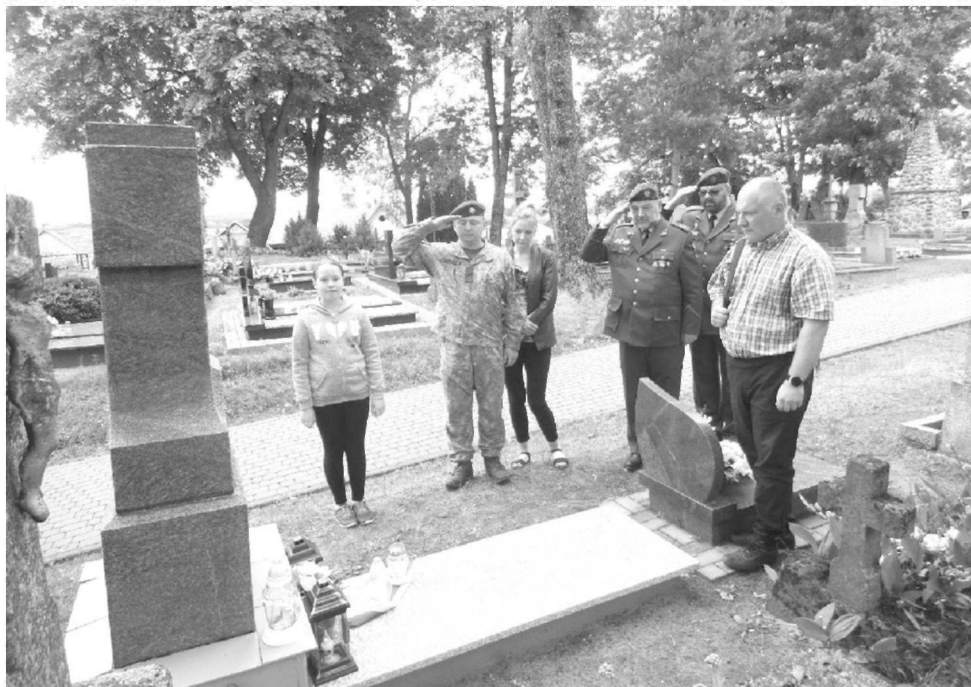
Alytaus Šv. Angelų Sargų bažnyčios šventoriuje pagerbiami Alytuje žuvę sukilėliai