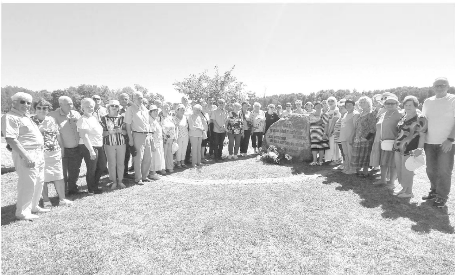
Lietuvos politinių kalinių ir tremtinių sąjungos atstovai Latvijoje prie paminklo laisvės kovotojams