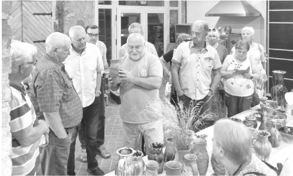
Kraslavos miestelyje amatų centre