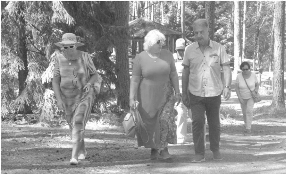
Gera pasivaikščioti po Kristaus karaliaus kalną