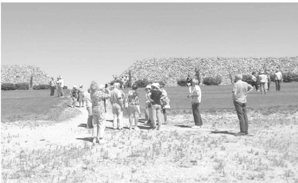
Aplankėme paminklus, skirtus laisvės kovotojams