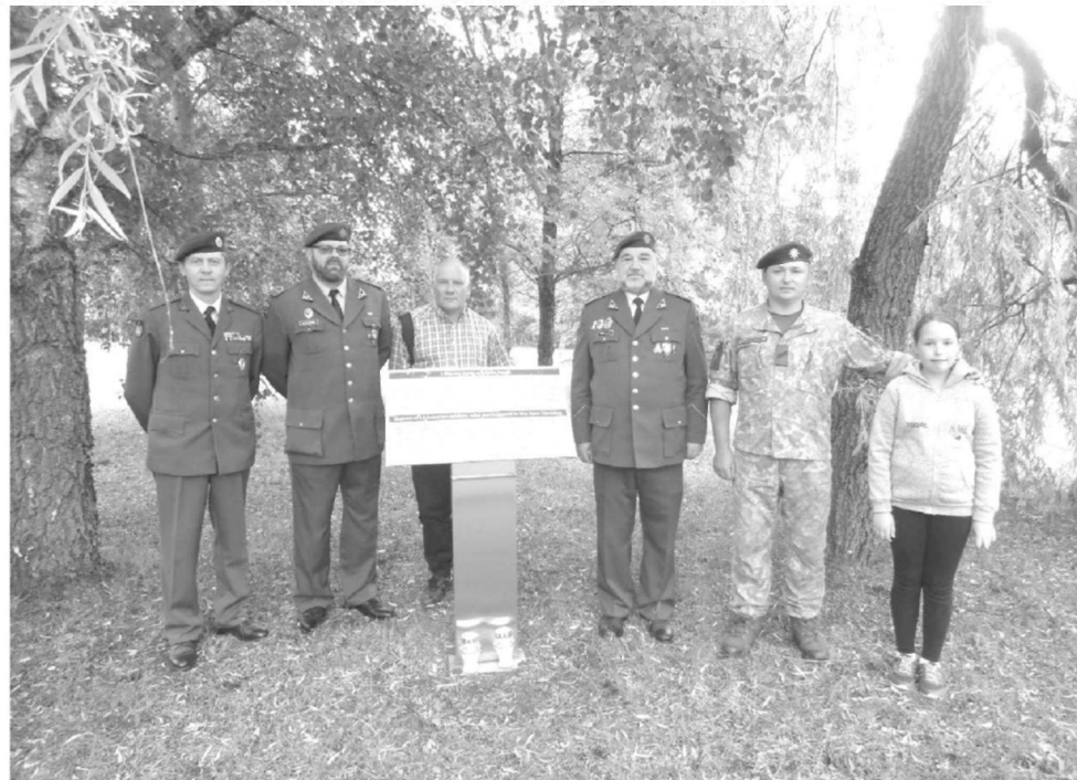
Prie memorialo 1941 m. birželio 22–26 d. Dzūkijoje žuvusiems 45-iesiems Lietuvos kariams-sukilėliams Alytuje, Skardžio gatvėje

Tenka apgailestauti, kad Alytuje pagerbiant Birželio sukilimo aukas „tradiciskai“ nedalyvavo nė vienas savi-