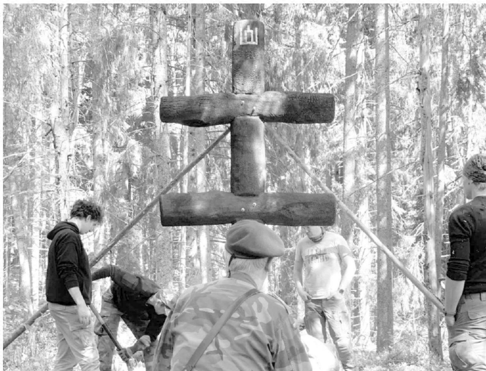
Partizano sūnus prie Juodojo dvigubo kryžiaus