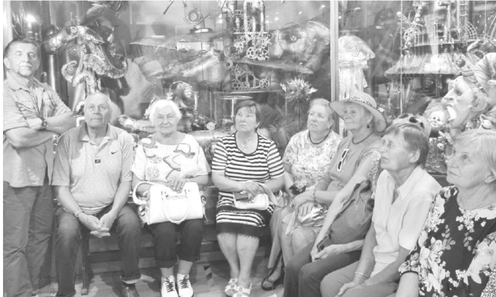
Preilės miestelyje privačiame lėlių muziejuje