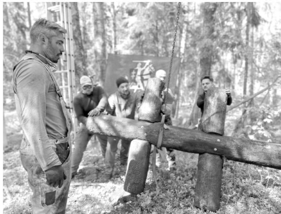
Kryžiaus statymo darbai

„Dažnai pastebima, kad senosiose lietuvių liaudies dainose galima rasti daugybę simbolikos, alegorijų, mitinio mąstymo, tad nepažįstant šios poetinės kalbos galima iš viso nesuprasti dainos prasmės. Ne išimtis ir karinės – istorinės dainos, kuriose apie kritusį karį artimiesiems praneša parlėkęs žirgas ar užkukavusi gegutė, o konkrečių įvykių, istorijų ar asmenų paminėjimai čia būna ypač reti. Dainos neretai lyriškos, liūdnos ir kartais nusistebima, kad jos neuždegančios, nekeliančios kario ūpo. Bet, mano nuomone, šių dainų funkcija dažnai yra kitokia, nei vėlyvesnių karo dainų. Jos – tarsi nematomas sai-