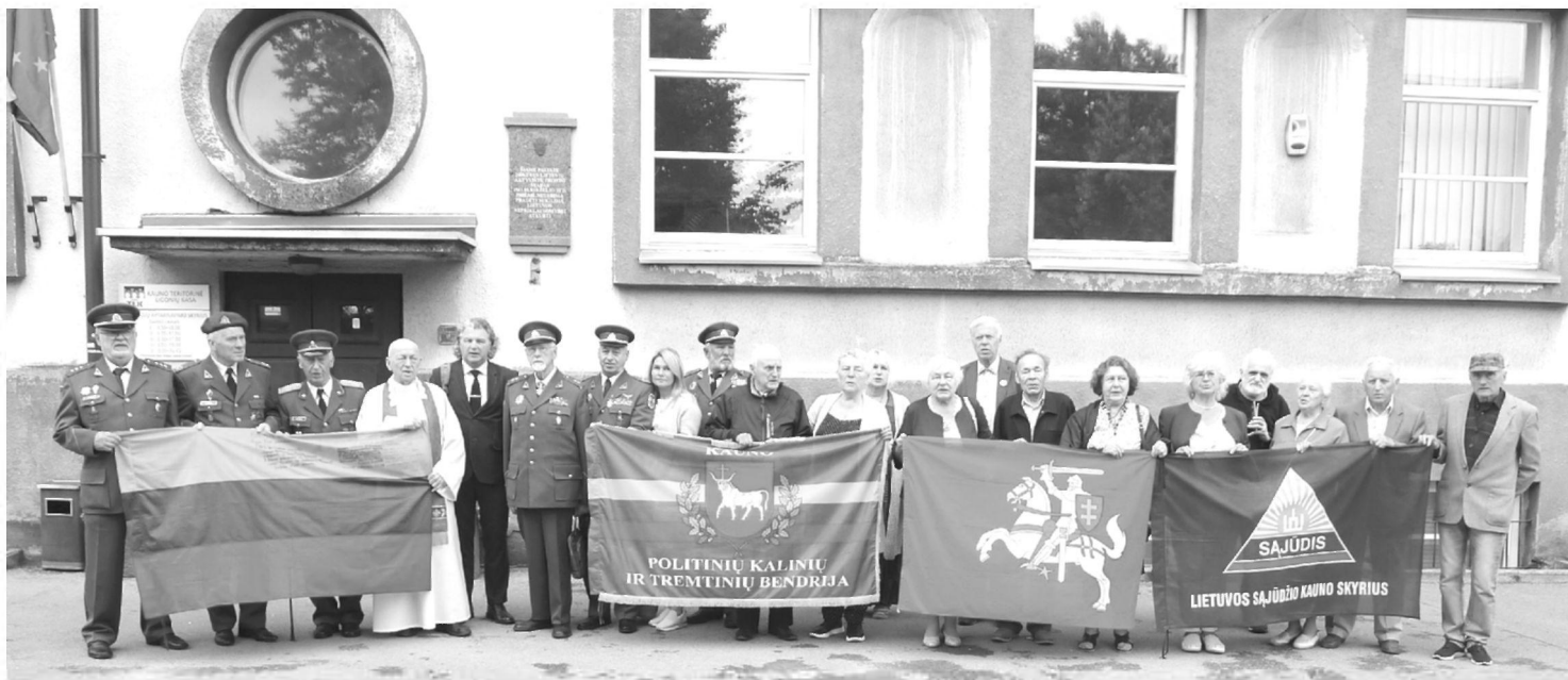
Minėjimo dalyviai prie pastato, kuriame buvo įsikūręs lietuvių aktyvistų fronto štabas

Šie metai prasidėjo minint Lietuvos vėliavos pakėlimo Gedimino kalne 105-ąsias ir mūsų literatūros klasiko Kristijono Donelaičio gimimo 310-ąsias metines. Toliau sekė Lietuvos laisvės kovos sąjūdžio tarybos 1949 m. vasario 16 d. pasirašytos Deklaracijos ir Lietuvos partizanų vado, konstitucinio Lietuvos prezidento Jono Žemaičio-Vytauto gimimo jubiliejinės datos. Gražiai paminėjome ir Lietuvos tapimo Šiaurės Atlanto sutarties organizacijos bei Europos Sąjungos narystės 20-ąsias metines. Antroje metų pusėje turėtume minėti pirmojo Lietuvos Respublikos prezidento Antano Smetonos 150-ųjų gimimo metinių jubiliejų ir kitas įsimintinas datas.