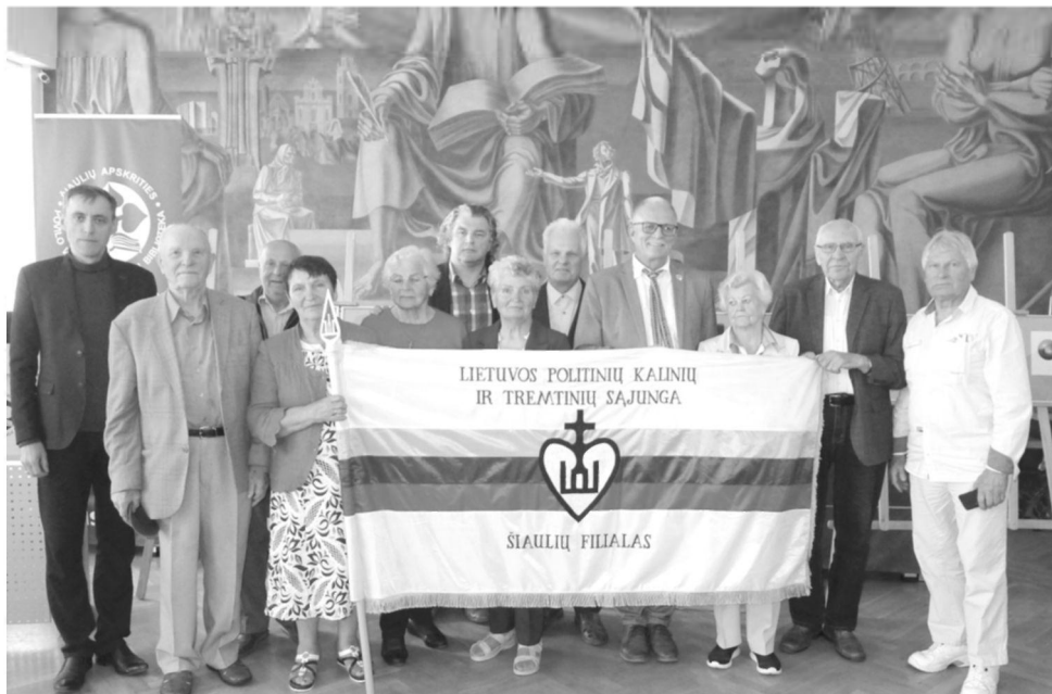
Renginyje dalyvavo LPKTS Šiaulių filialo nariai