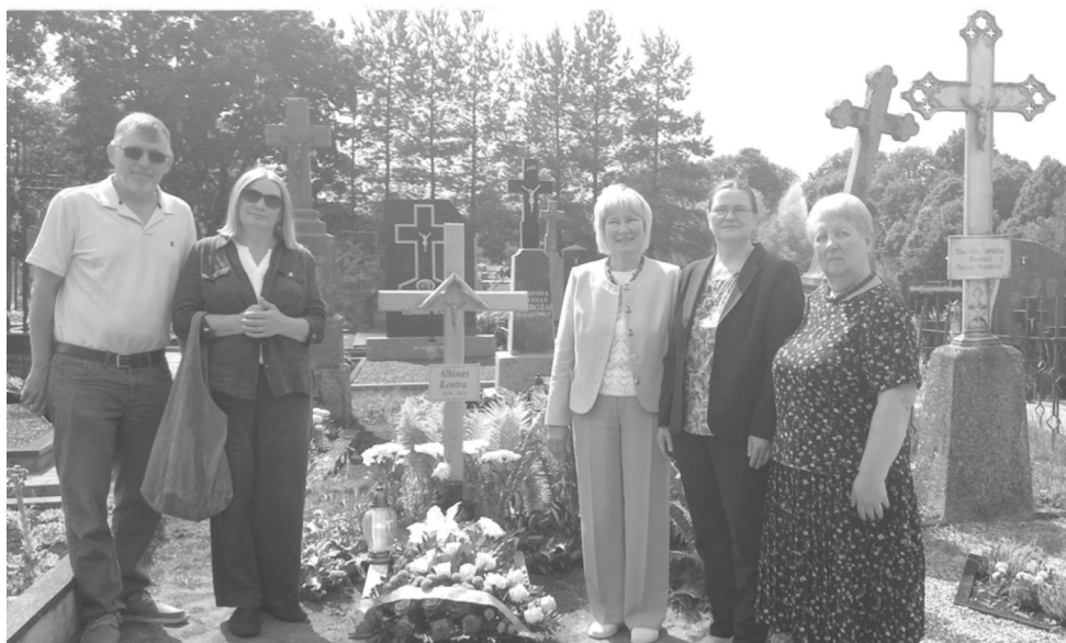
Šilalės miesto kapinėse buvo padėta gėlių ir uždegta žvakučių

„Ši šeima, atėjus lemtingam momentui, nesudvejojo ką pasirinkti, nėjo į kompromisą su savo sąžine. Jie pasirinko kovą už savo kraštą, už savo žemę, už savo ir vaikų ateitį. Ir šandien mes visoje Rytų Europoje esame unikalūs tuo, kad mūsų partizaninė kova niekada nenutrūko. Ji tęsiasi metai iš metų, nepaisant taikomų politinių represijų, trėmimų ir kalinimų, kurie vyko banga po bangos. O šandien tai yra ženklas ir istorinis faktas, kad niekas nenutrūko, niekas nepasibaigė, kad tie tikslai buvo keliami iki paskutinio atodūso „Atiduok Tėvynei, ką privalai“.