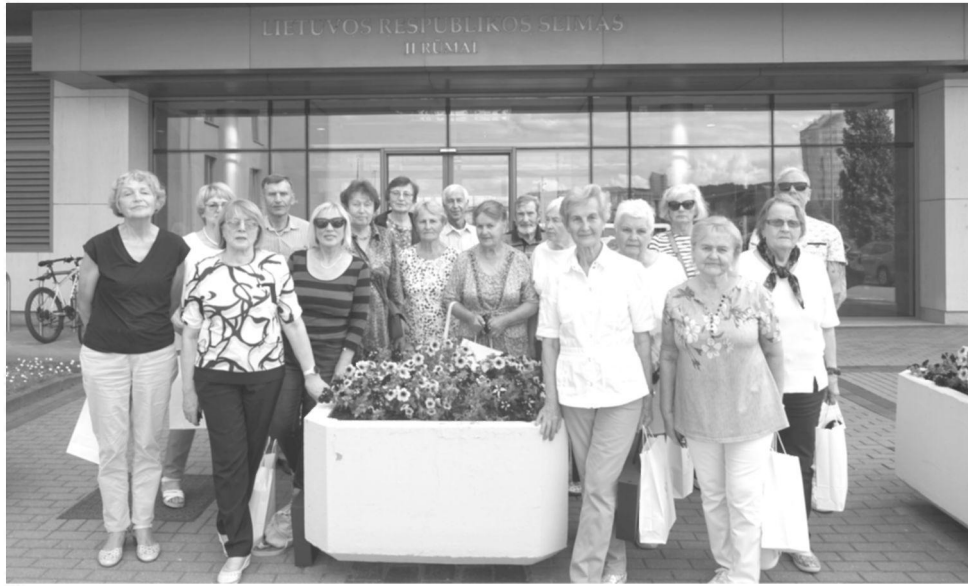
Keliauninkai Seimo rūmuose

Seimo nariai trumpai papasakojo apie paskutinių Seimo posėdžių aktua-