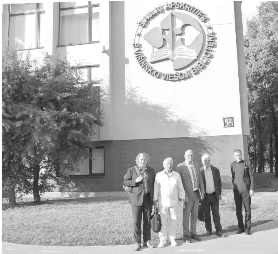
Kauniečių delegacija prie Povilo Višinskio viešosios bibliotekos