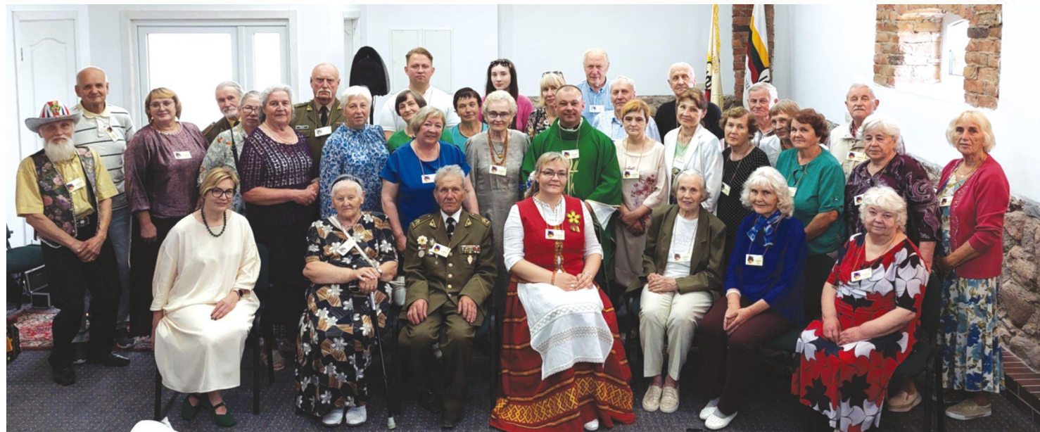
Sąskrydžio šeimininkai, organizatoriai, svečiai ir dalyviai