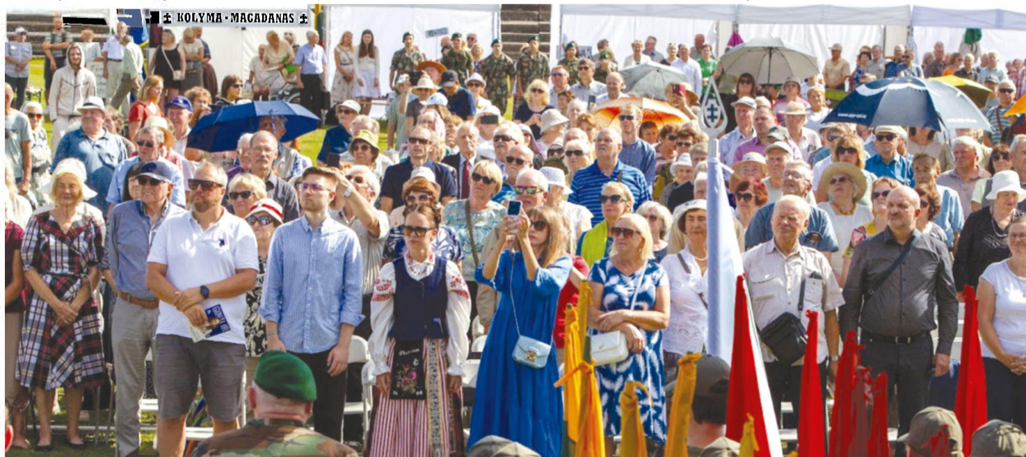
Dubysos slėnyje sąskrydžio svečiai ir dalyviai