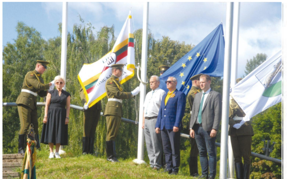
Vėliavų pakėlimo ceremonija