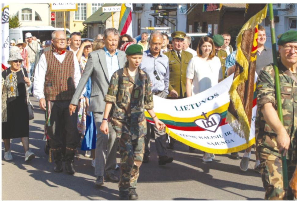
Lietuvos politinių kalinių ir tremtinių sąjungos vėliavą neša Biržų filialo atstovai

Prisimenant tėvus ir senelius, brolius ir seseris, kritusius pasipriešinimo kovose, negrįžusius iš lagerių ir tremčių, išėjusius Amžinybėn, jų atminimas pagerbtas tylos minute. Lietuvos kariuomenės Garbės sargybos kuopos kariai išnešė gėles prie Kankinių memorialo Ariogalos kapinėse.