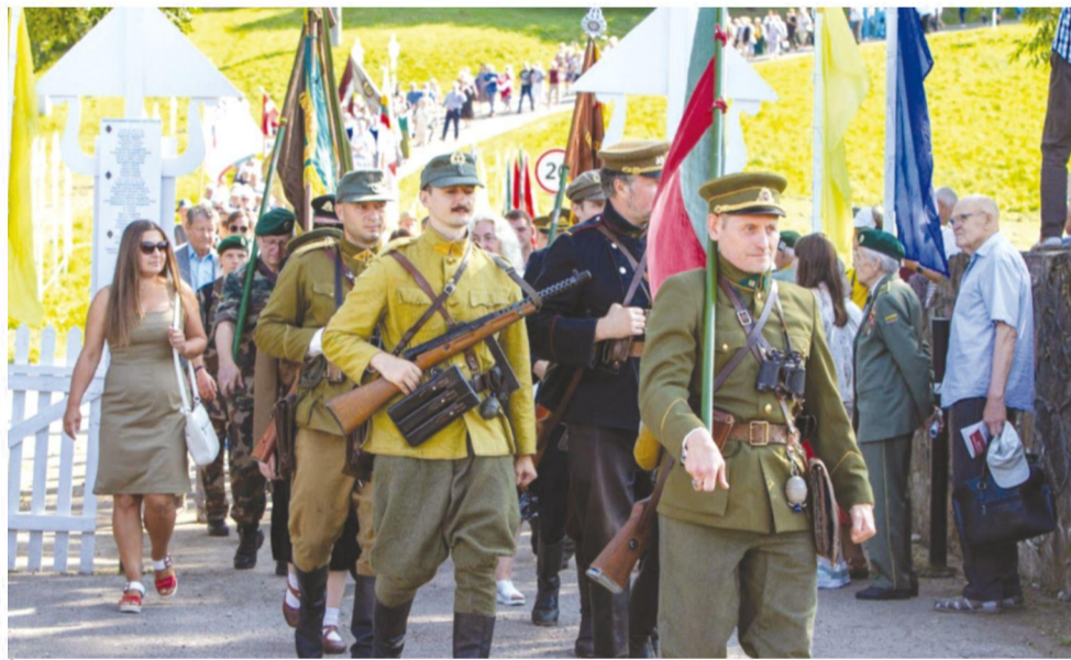
Eisenoje karo istorijos rekonstruktorių klubas „Partizanas“