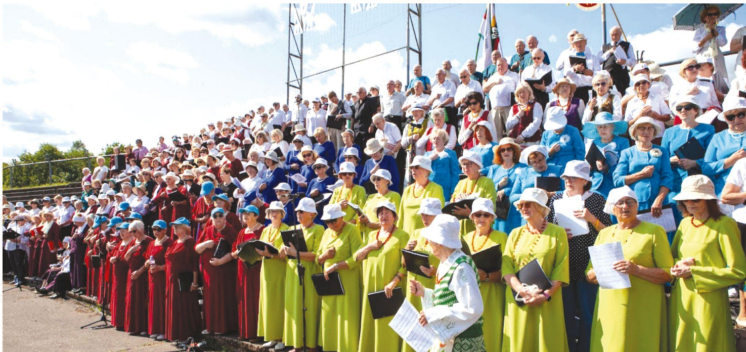
Dainuoja jungtinis buvusių tremtinių choras

Diskusijų palapinėje vyko pokalbiai su Seimo nariais. Sąskrydžio dalyviai aktyviai uždavinėjo klausimus jiems rūpimais klausimais. Po diskusijų vyko parodų, kurios papuošė šią palapinę, pristatymai. Buvo galima susipažinti su naujausiomis knygomis ir jas įsigyti stadiono prieigose buvusiame knygynėlyje. Partizanų bunkeryje veikė ginklų paroda, buvo galima išgirsti pasakojimus apie laisvės kovas.