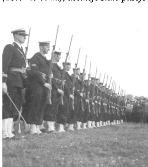
Lietuvos karinio laivo „Prezidentas Smetona“ Mokomojo būrio karių paradas, 1936–1939 m.