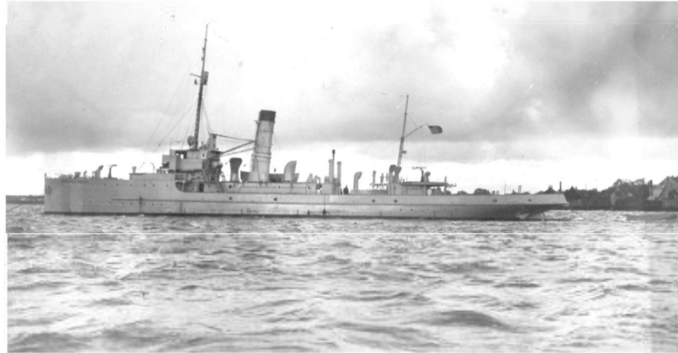
Lietuvos laivyno laivas „Prezidentas Smetona“ Klaipėdos uoste, XX a. 4 deš.