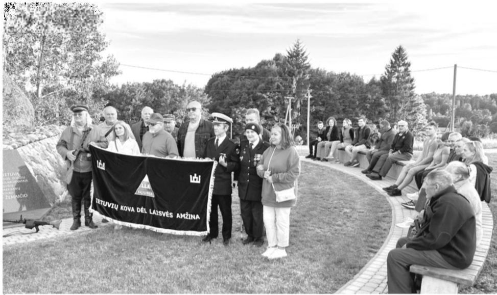
Prie paminklo Vladui Montvydui-Žemaičiui