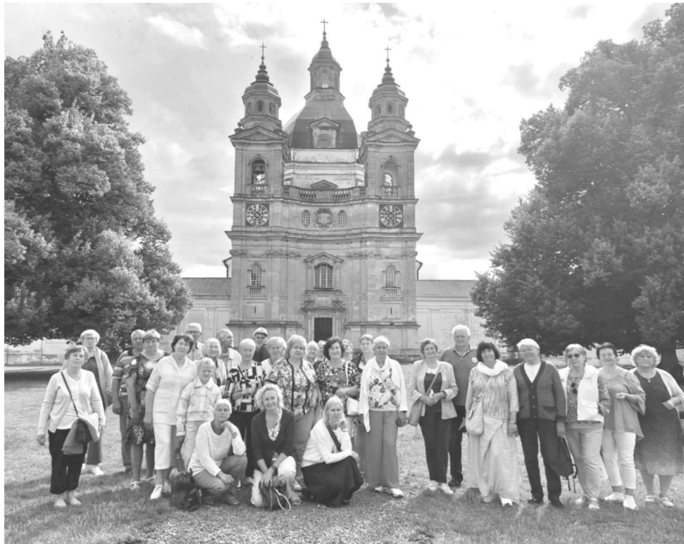
Ekursijos dalyviai šilutiškiai prie Pažaislio vienuolyno