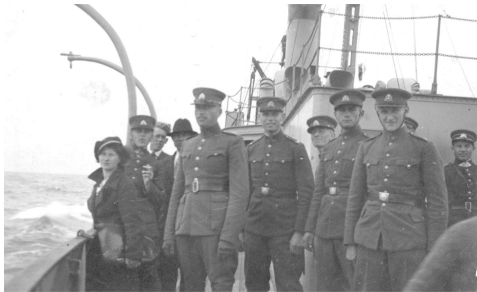
Lietuvos kariuomenės kariai karo laive „Prezidentas Smetona“. Apie 1936 m.