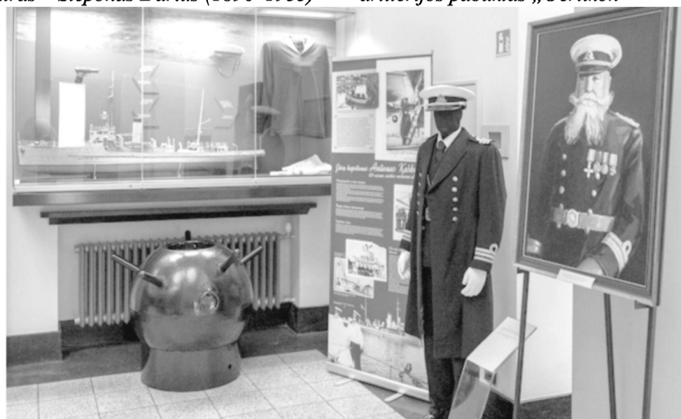
Karinio jūrų laivyno ekspozicija ir mini paroda Vytauto Didžiojo karo muziejuje