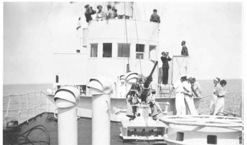
Lietuvos karo laivo „Prezidentas Smetona“ denis, įgulos nariai ir svečiai plaukiojimo metu. Klaipėda. 1935–1940 m. Laivo priekyje – 20 mm priešlėktuvinės artilerijos pabūklas „Oerlikon“